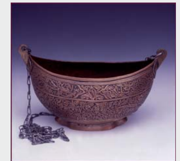
Bolsa limosnero (hazhul), Afganistán. S.XX. MNA.