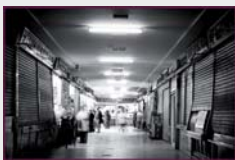
"Mercado" de Sergio Maldonado.

Una muestra que nos permitirá entender como ven los jóvenes las calles y gentes de Madrid, desde un punto de vista espontáneo y dinámico.