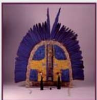
Máscara. Grupo étnico tapirapé. Brasil. s.XX. MNA

Organiza: Museo Nacional de Antropología. En esta exposición mostramos al público la importante labor de los conservadores-restauradores a la hora de preservar estas magníficas piezas de arte plumario del Museo y, sobre todo, queremos transmitir un mensaje que consideramos fundamental: lo que hoy conservemos será el legado cultural de las futuras generaciones, por lo que no podemos descuidarnos ni un segundo en nuestra tarea.