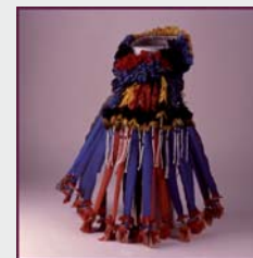
Cuinraida. Grupo étnico eripotó. Brasil. MNA.

Los bosques son lugares maravillosos donde el hombre ha encontrado siempre cobijo y alimento. A pesar de esto, muchas veces no los hemos sabido cuidar como se merecen. En este taller es invitamos a conocer mejor algunos de los bosques más importantes de nuestro planeta desde el punto de vista natural y también cultural y así aprender todo lo que nos han aportado. ¡No te andes por las ramas y apúntate!