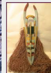
Máscara Grupo étnico nalu. Guinea Bissau. MNA.