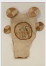
Máscara. Grupo étnico ticuna. Perú, Colombia y Brasil. Área amazónica. MNA.

El MNA abre la Sala de América a este recorrido temático que abordará uno de los temas centrales para la antropología: los ritos de paso. A través de las piezas en exposición, presentaremos culturas de pueblos de América, desde el punto de vista de las fases por las cuales la humanidad marca sus cambios: nacimiento, pubertad social, matrimonio, maternidad/paternidad, progresión de clase, especialización ocupacional, muerte.